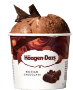
Belgian Chocolate 벨지안 초콜릿