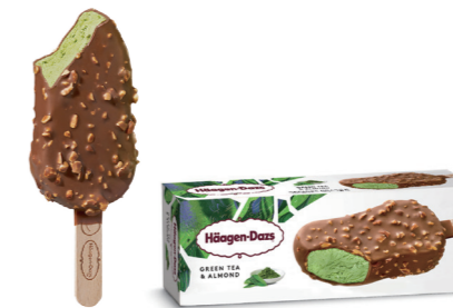
Green Tea & Almond 그린티 & 아몬드